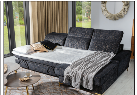
pow. leżenia w module 2,5F: 234x113 cm