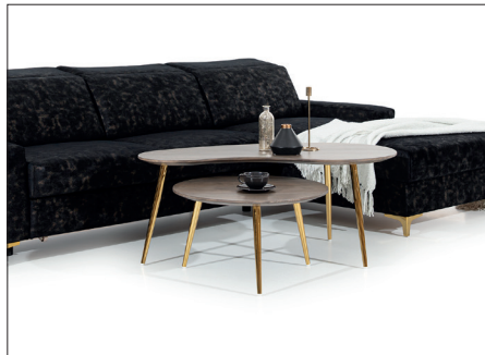
do narożnika pasują stoliki D-86 i D-87